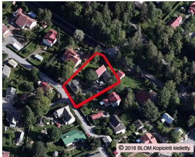
Ilmakuva suunnittelun alueesta 2018